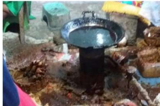
Gambar 2. Penutup kompor

Gambar diatas yaitu kompor, biasanya para pekerja menutup kompor dengan kardus agar api yang kecil tidak padam. Akan tetapi hal itu dapat menyebabkan terjadinya kebakaran.