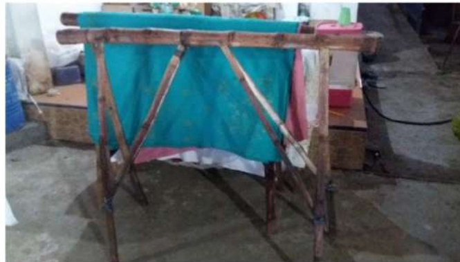
Gambar 1. Gawangan Untuk Membatik

Berdasarkan uraian pada analisis situasi tersebut, maka permasalahan utama mitra adalah alat pembantu proses membatik yang kurang memadai dan aman. Mitra 1 yaitu Batik Sari Kenongo, pelaku pengrajin batik tulis yang masih melakukan usahanya secara tradisional, dalam proses produksi, pengelolaan manajemen dan sistem pemasaran. Masalah yang sering dihadapi oleh para pekerja saat proses produksi yaitu alat pembantu proses membatik yang kurang memadai.